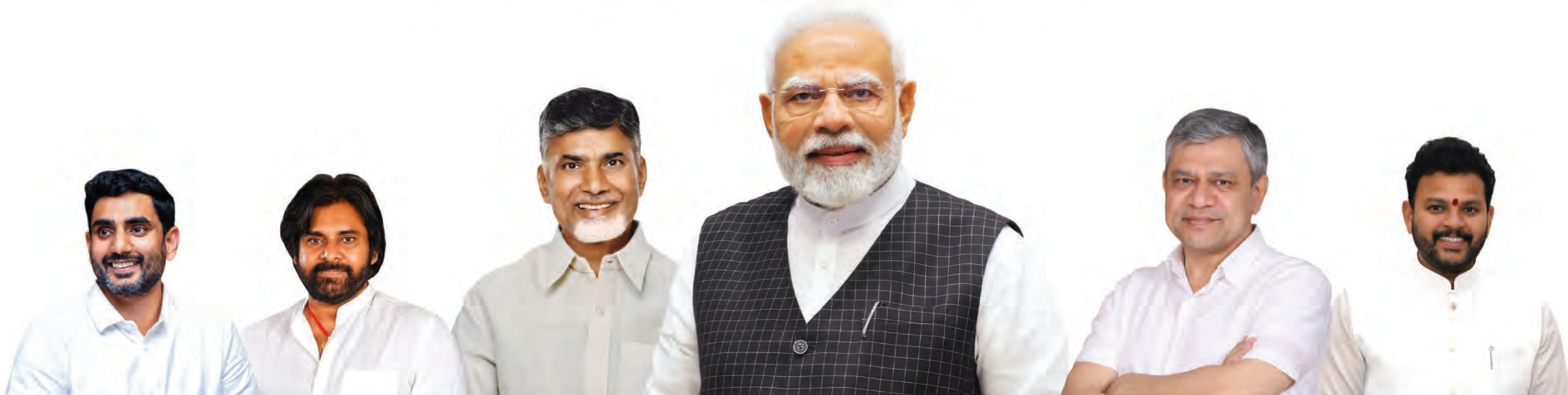
శ్రీ నారా లోకేష్ గౌరవనీయులైన ఐటీ మంత్రి ఆంధ్రప్రదేశ్

ఏజ్ హబ్ కు శంకుస్థాపన: స్వచ్ఛమైన గ్రీన్ ఎనర్జీ తో కూడిన కంప్యూటింగ్, కనెక్టివిటీ, కవరేజ్ ఒకే చోట.