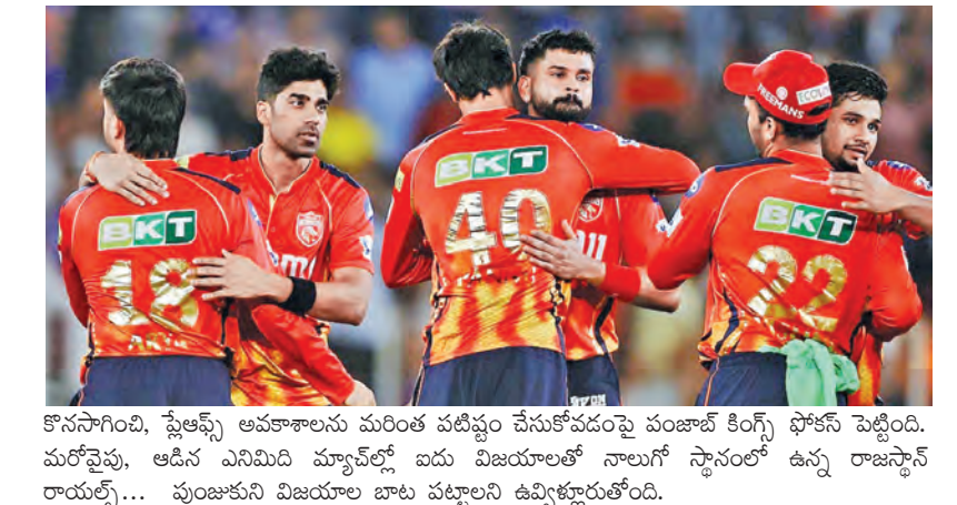
కొనసాగించి, ఫ్లేఆఫ్ అవకాశాలను మరింత పటిష్టం చేసుకోవడంపై పంజాబ్ కింగ్స్ ఫోకస్ పెట్టింది. మరోవైపు, ఆడిన ఎనిమిది మ్యాచ్లో ఐదు విజయాలతో నాలుగో స్థానంలో ఉన్న రాజస్థాన్ రాయల్స్... పుంజుకుని విజయాల బాట పట్టాలని ఉప్పొంగుతుంది.

చండీఘడ్: మొత్తానికి ఐపీఎల్ 2026 సీజన్లో పంజాబ్ కింగ్స్ అద్భుతమైన ఫామ్తో దూసుకుపోతోంది. ప్రస్తుతానికి ఆ జట్టును అపడం ఇతర జట్లకు కష్టంగా మారింది.ఈసీజన్లో పంజాబ్ కింగ్స్ జట్టులోని ఆడిన మ్యాచ్లో ఓటమి ఎరగకుండా దూసుకుపోతోంది. 6 మ్యాచ్లో గెలుపొందగా, ఒక మ్యాచ్ వరల్డైన అయింది. 13 పాయింట్లతో టాప్ పొజిషన్లో ఉంది. గత ఏడాది త్వరితగతినే పంజాబ్ కింగ్స్ టోపీని ఈసారి ఎట్టిపరిస్థితుల్లోనూ అందుకోవడమే లక్ష్యంగా దూసుకుపోతోంది. అర్చీబి, ముంబై ఇండియన్స్, చెన్నై సూపర్ కింగ్స్ వంటి బలమైన జట్లపై కూడా పంజాబ్ సులభంగా విజయం సాధించింది. శ్రీయాస్ కెన్యాన్లో పంజాబ్ కింగ్స్ జట్టులో సరికొత్తన ఆఫ్టివ్ నెట్టింగ్ సందర్భంగా సర్వం సాధించింది. సర్వం సాధించిన జట్టును విజయవంతం చేసింది. జట్టులోని వనరులను చక్కగా ఉపయోగించుకుంటున్నాడు. ముఖ్యంగా ఓపెనింగ్ ప్రభాసిహూస్ సింగ్, ప్రియాన్స్ అర్చి అందిస్తున్న విద్యనకర ఆరంభాల్లో జట్టు విజయాల్లో కీ రోల్ పోషిస్తున్నాయి. ఎంతలా అంటే డీసీపై వసర్ ఫ్లే ఆరు ఓవర్లలోనే 116 రన్స్ సాధించారు. ఆరంభాల్లోనే వసర్ కానోలీ, శ్రీయాస్ అయ్యర్, సేహల్ వదేరా, స్ట్రోయిన్స్ వరకు అందరూ విద్యనకరంగా అందుదా భారీ స్కోర్లు సాధిస్తున్నారు. ఈ క్రమంలో నేడు పంజాబ్ కింగ్స్ తో రాజస్థాన్ రాయల్స్ తలపడుతోంది. శ్రీయాస్ సేనను రాయల్స్ అడ్డుకుంటుందా? పంజాబ్ కు తొలి ఓటమి రుచి చూస్తుందా? లేదా యుగావిధిగా పంజాబ్ ఖాతాలో ఏదో విజయం చేరుతుందా? అన్నది ఆసక్తిగా మారింది. తమ విజయ పరంపరను